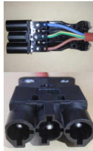
Abbildung: Buchse / Ausgang

Liegt ca. 5,5 cm – mit Kabelknick ca. 7cm außerhalb der Bank