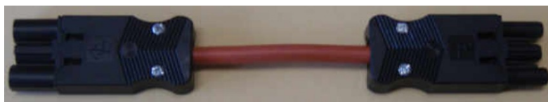
Abbildungen: Beispiel Verbindungskabel Stecker

Liegt ca. 5,5 cm – mit Kabelknick ca. 7cm außerhalb der Bank